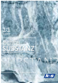
Unternehmens- und Nachhaltigkeitsbericht 2009 Corporate and Sustainability Report 2009

Bitte freimachen Please affix a correct postage