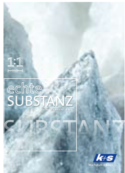
Finanzbericht 2009 Financial Report 2009

K+S Aktiengesellschaft, Kassel • ISIN: DE0007162000 • Wertpapier-Kenn-Nr. 716 200